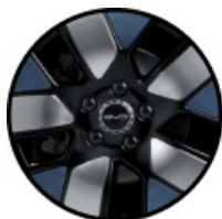
חישוקי סגסוגת אלומיניום בשילוב שלושה צבעים