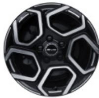
חישוקי סגסוגת אלומיניום בשילוב שני צבעים