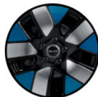
חישוקי סגסוגת אלומיניום בשילוב שלושה צבעים