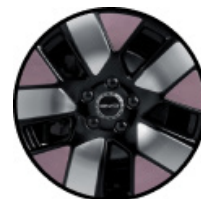
חישוקי סגסוגת אלומיניום בשילוב שלושה צבעים